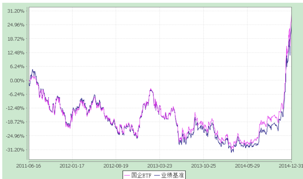
上证国有企业 100 交易型开放式指数证券投资基金 份额累计净值增长率与业绩比较基准收益率的历史走势对比图 (2011 年 6 月 16 日至 2014 年 12 月 31 日)

注：按基金合同规定，本基金自基金合同生效起3个月内为建仓期，截至建仓结束时本基金的各项投资比例已达到基金合同第十六部分（三）的规定，即本基金主要投资于标的指数成份股、备选成份股。为更好地实现投资目标，本基金可少量投资于非成份股、新股、债券及中国证监会允许基金投资的其他金融工具。在建仓期完成后，本基金投资于标的指数成份股票及备选成份股票的比例不低于基金资产净值的90%，但因法律法规的规定而受限制的情形除外。法律法规或监管机构日后允许本基金投资的其他投资工具，基金管理人在履行适当程序后，可将其纳入投资范围。